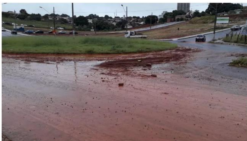
FOTO 05 - Jornal Integração relatando o acontecimento.

Diante do exposto, e visto que as intempéries climáticas estão fora do planejamento, não cabe à empresa executora da obra de construção da Escola Alice Moura realizar a troca do forro. Portanto, solicitamos a contratação de empresa, incluindo fornecimento de material e mão de obra, para instalação e reforço estrutural de forro de PVC.